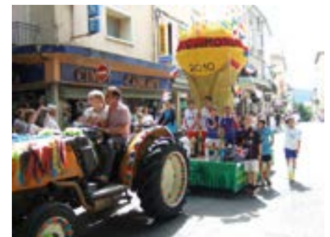
Le char du football lors d'un corso. La relève des élèves serait-elle en préparation?

1972 Les élèves 1973, 74, 75, 76 Les profs 1977, 78, 79, 80 Les élèves 1981 Les profs 1982 Les élèves 1983, 84, 85 Les profs fin en 1986 faute de profs