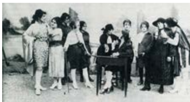
1920 - Le Barbier de Séville joué par de jeunes femmes de Vaison