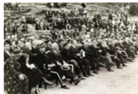
Le parterre d'autorités lors de la représentation des Phéniciennes

resta longtemps mécène du festival. Les représentations commencèrent à intégrer le théâtre antique malgré l'inconfort des vieilles pierres récemment dégagées. Nous terminerons provisoirement sur celle du 17 juillet 1932 qui réunit le gratin politique de la ville,