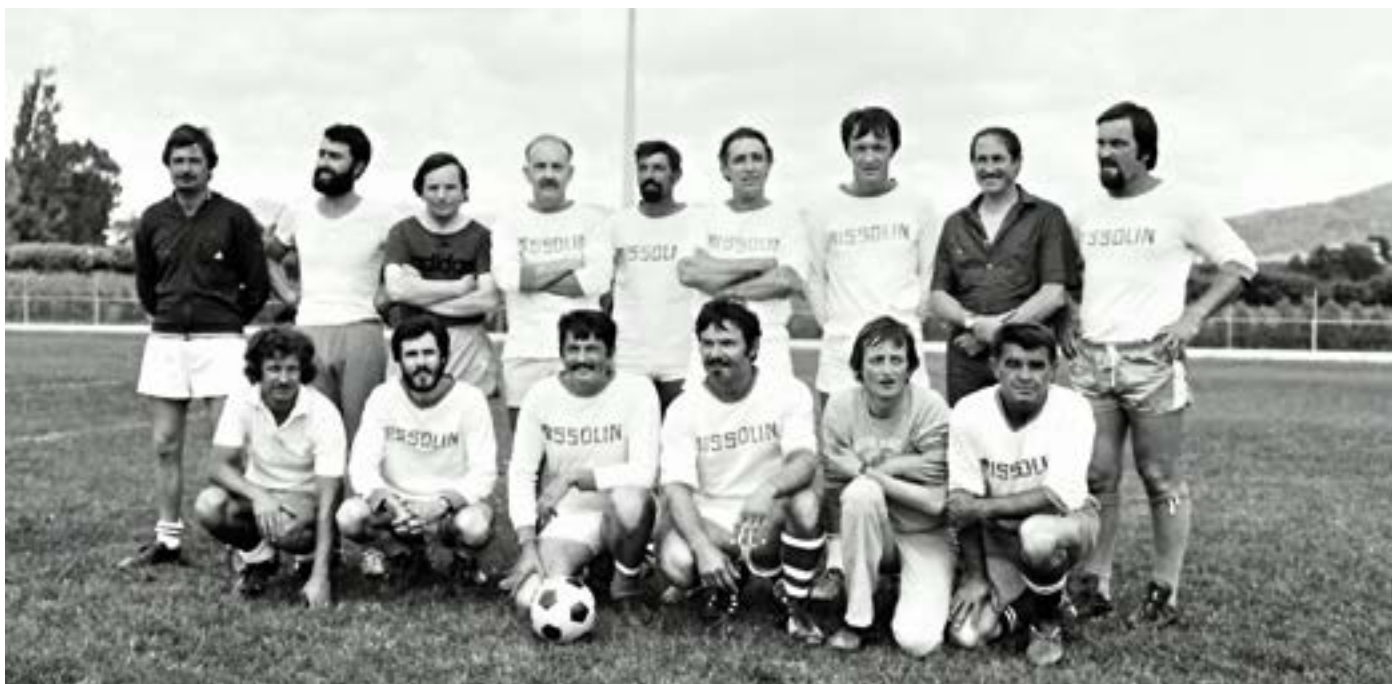
Les « Profs »

Ils se doutaient peut-être que les petits élèves allaient devenir eux aussi de grands noms vaisonais.