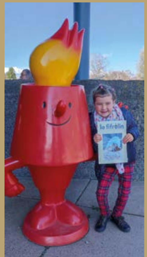
Lily Roux, en visite au Futuroscope