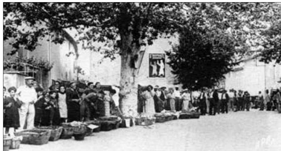
Marché aux cerises.