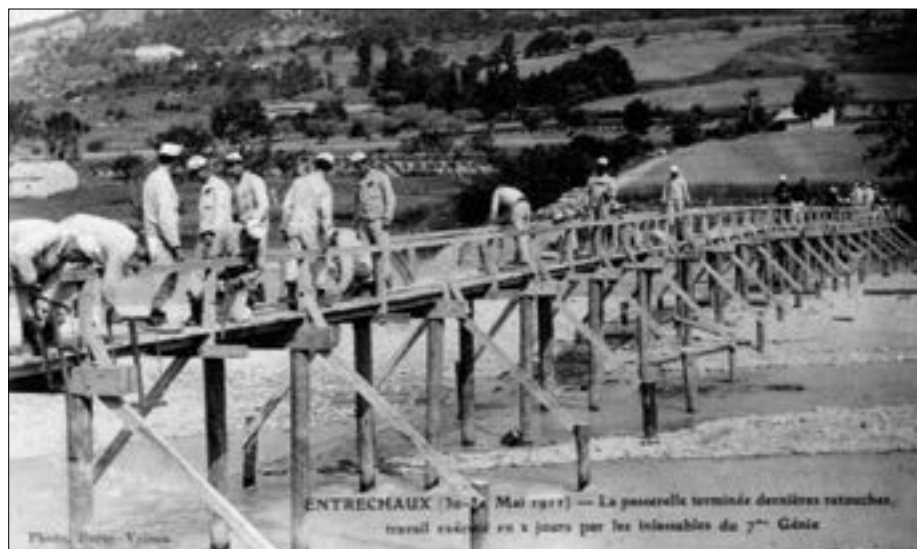
Entrechaux (30 au 31 mai 1911) - La passerelle terminée, dernières retouches, travail exécuté en 2 jours par les inlassables du 7 me Génie (commentaire de l'éditeur de la carte).