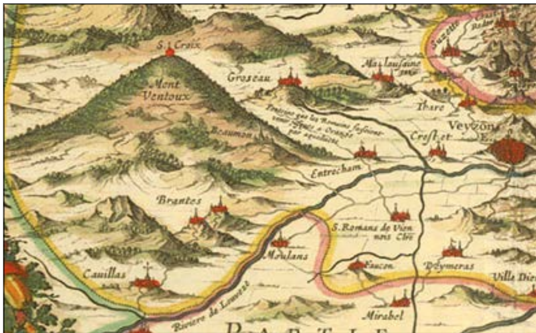
Détail de la carte du Comtat Venaissin de Jacques de Chièze Orangeois en 1627

Entrechaux a le privilège d'ouvrir la ronde des villages autour de Vaison. La ronde sera en musique avec, bien entendu, du tambourin et surtout du fifre, sorte de flûte traversière bien connue, en canne de Provence.