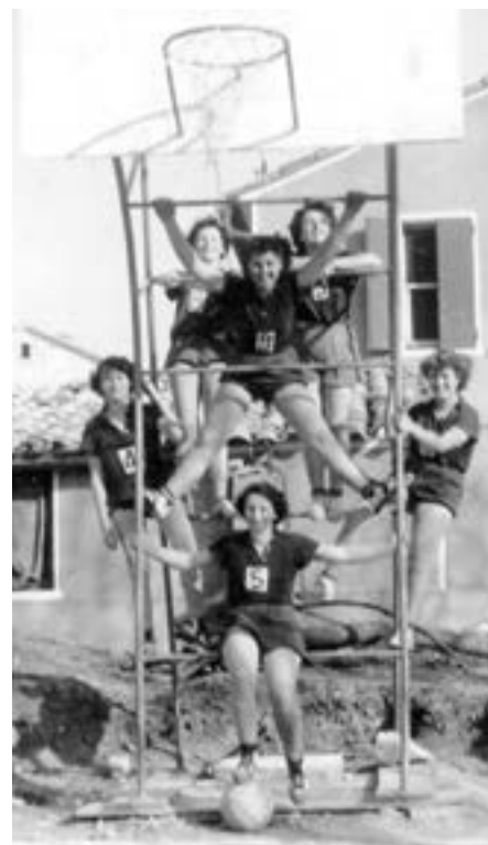
Jeunes basketteuses Entrechalaises en 1946.