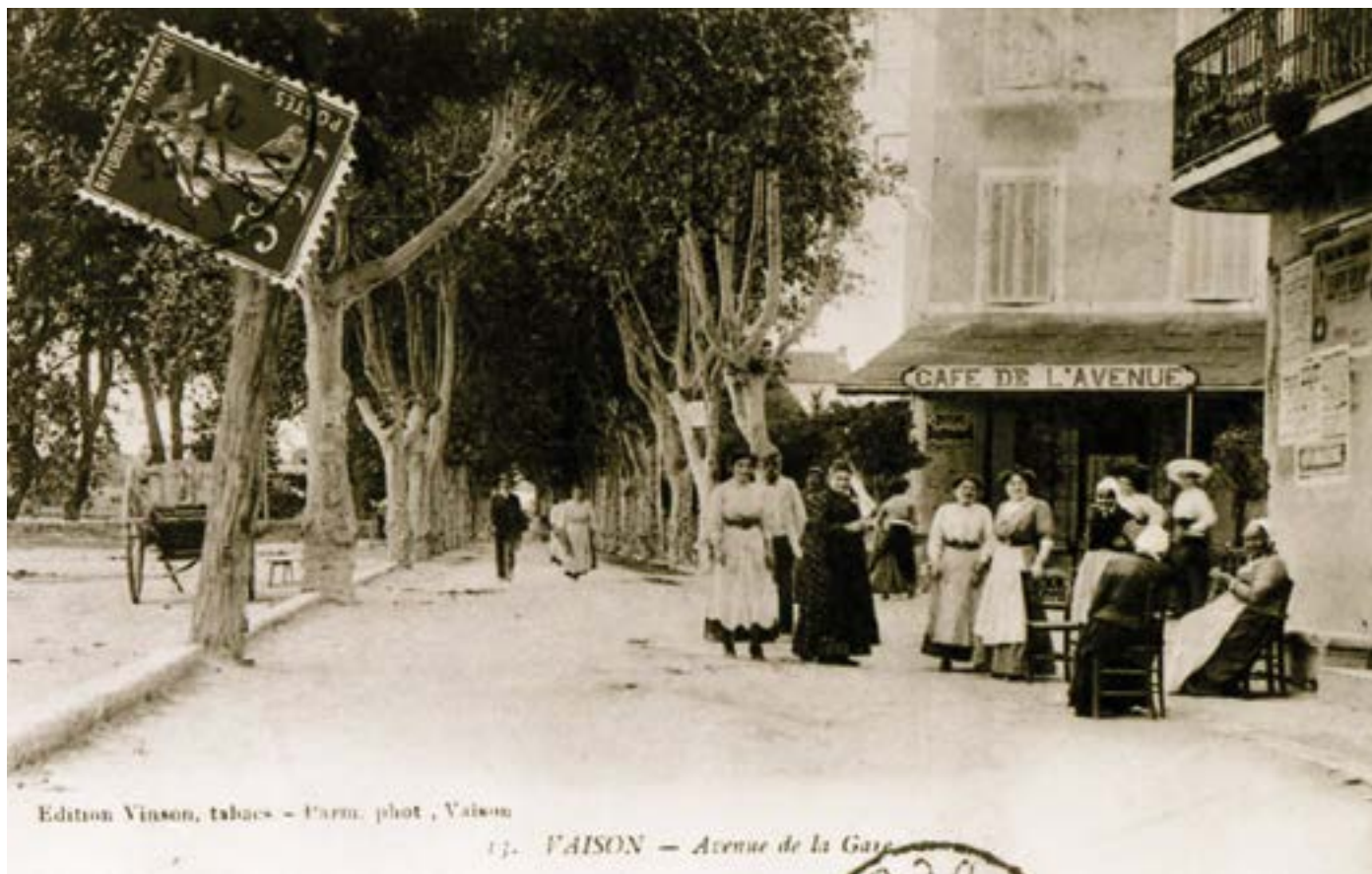
La buvette devient Café de l'Avenue.