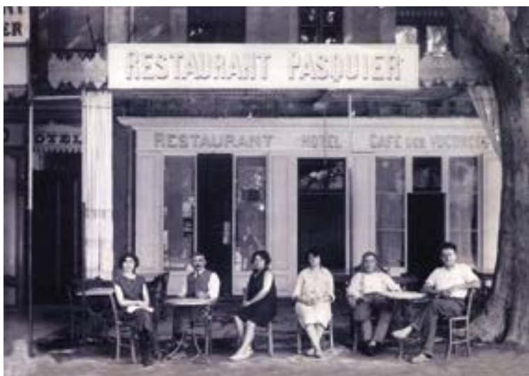
Hôtel-Restaurant Pasquier en 1929