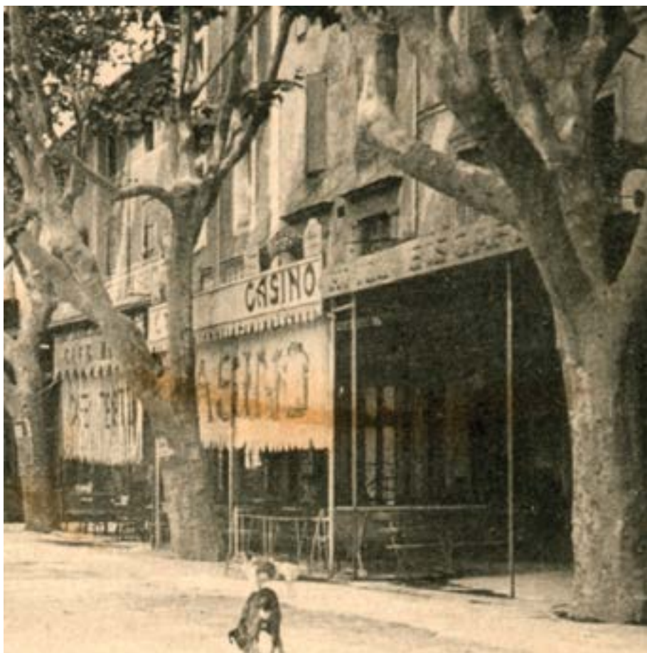
Au début du XXe siècle, au-dessus du café du Casino se tenait l'hôtel-restaurant de Constant Brivet repris par Paul Ricou en 1920.