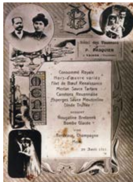
Un menu de chez Pasquier en 1911. Bœuf, merlan, caneton et dinde se succèdent à profusion

Il y avait encore le Bar des Glaces sur le côté Est après la quincaillerie Jullien. Puis le Café Gallien sur le côté Sud au coin de la montée vers la Place Sus-Auze sur laquelle on trouvait le Café de la Place, devenu brasserie Chez Maria et de nos jours La Bartavelle.