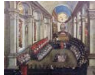
Concile de Trente