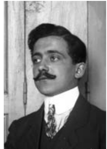
Octave Jullien vers 1910

sont moins importants. La marchandise se vend avec les Billets Monnaies Matières. Les artisans touchent à la mairie ces billets leur donnant droit d'acheter un, dix, cent ou cinq cents kilos d'acier, vingt kilos de fonte, deux kilos de tôle mince (tuyau de poêle), cinq kilos de clous à ferrer, un kilo de carbure pour les personnes ne s'éclairant pas à l'électricité. Puis, ils viennent retirer la marchandise qui les intéresse en échange de ces billets. Ceci dans le but de rationner les fournitures et les produits de première nécessité tels que les vêtements, l'essence, le pain, le tabac, car les usines et les fonderies sont essentiellement mobilisées pour le matériel de guerre. La guerre a été de tout temps un