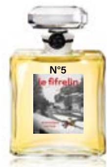
1921 - 2021 CENT ANS POUR LE CÉLÈBRE PARFUM CENT PAGES POUR LE FIFRELIN